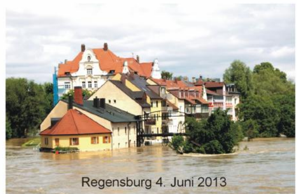
Regensburg 4. Juni 2013