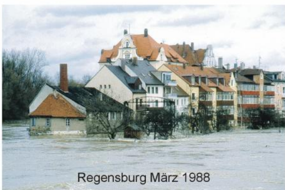
Regensburg März 1988