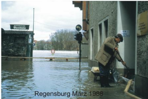
Regensburg März 1988