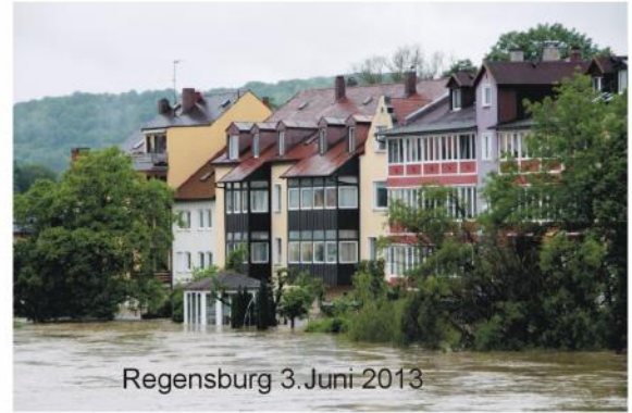
Regensburg 3. Juni 2013