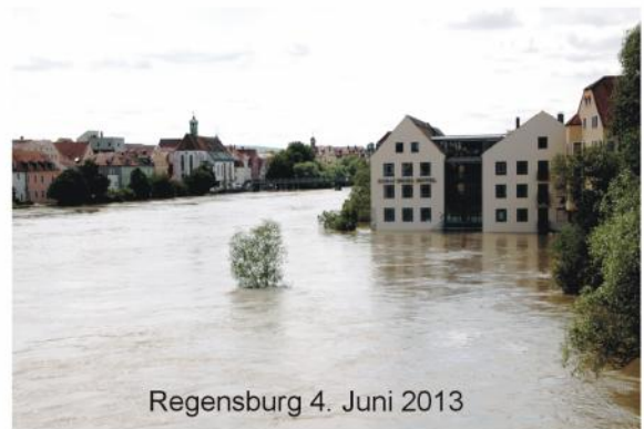
Regensburg 4. Juni 2013