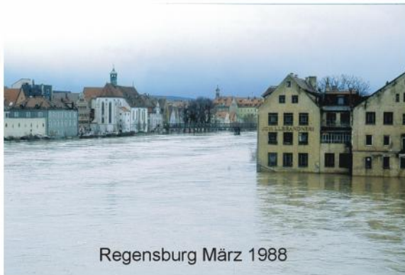
Regensburg März 1988