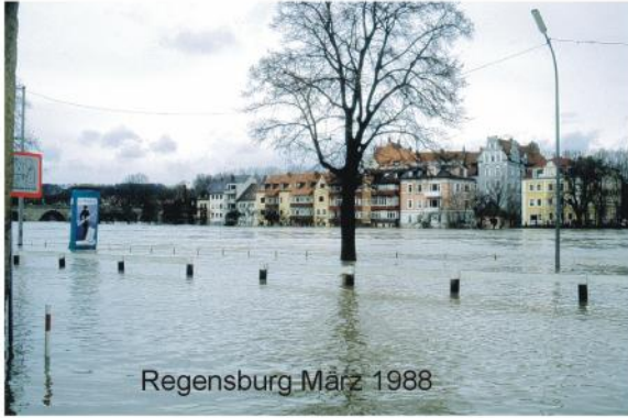
Regensburg März 1988